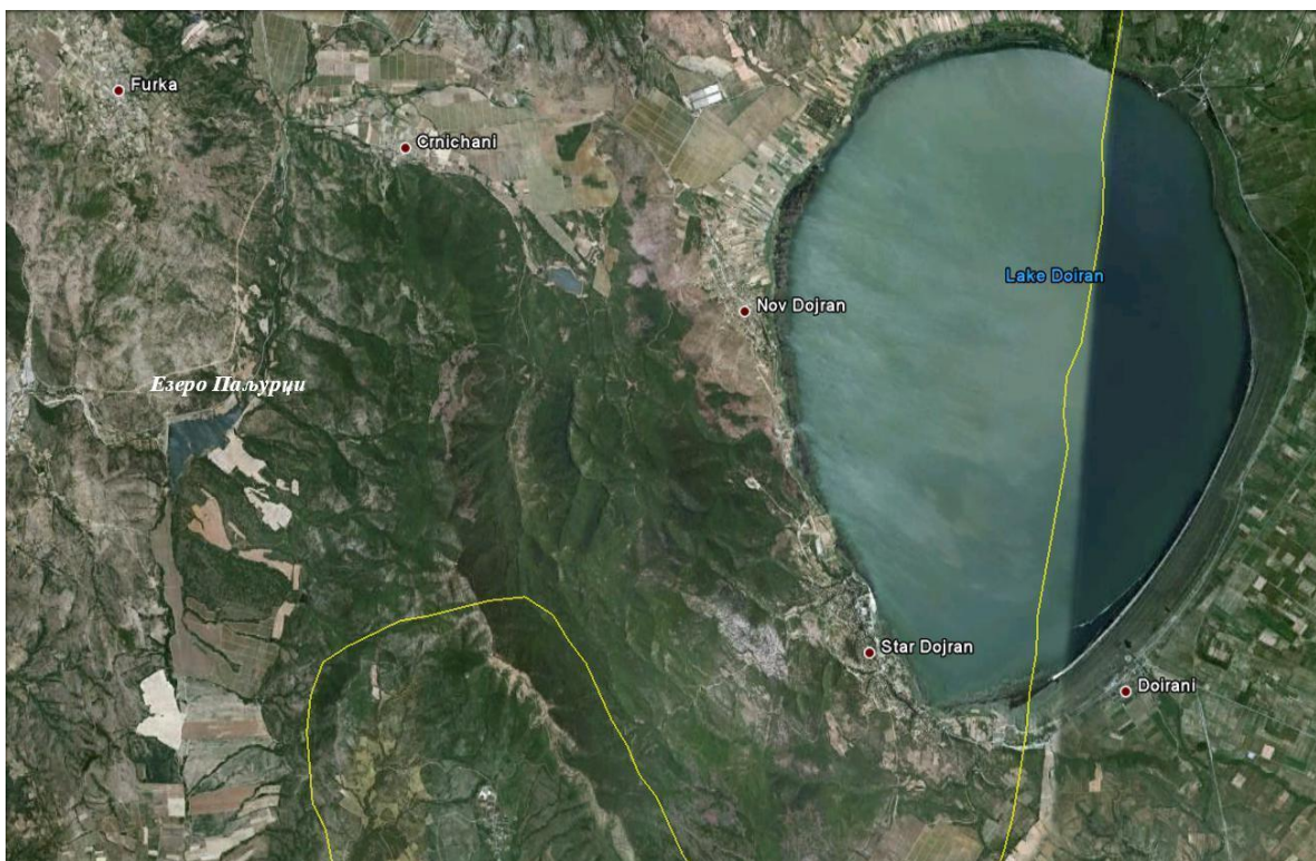
Слика 2. Сателитски приказ на акумулацијата Паљурци